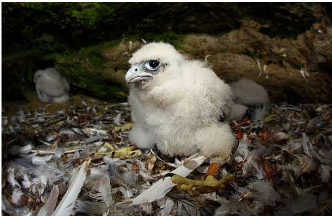
Mládě sokola stěhovavého