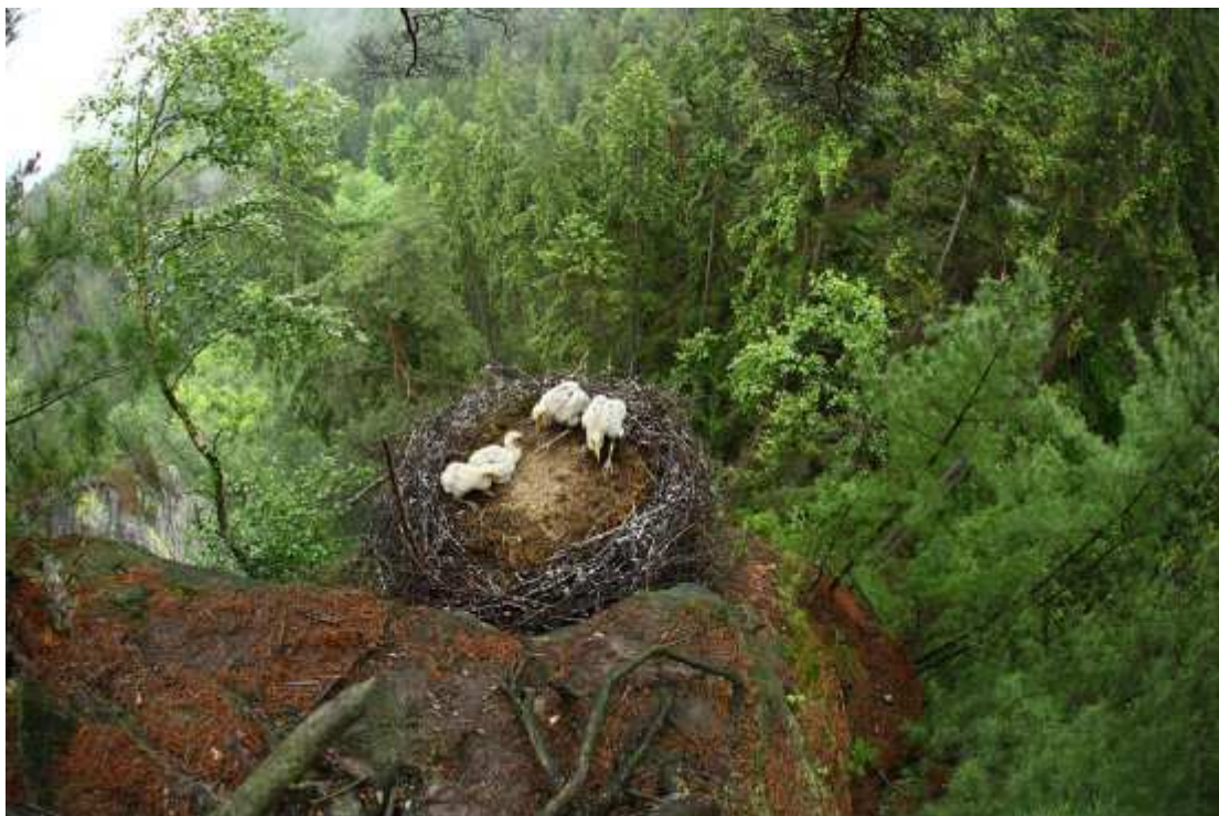
Hnízdo čápů černých