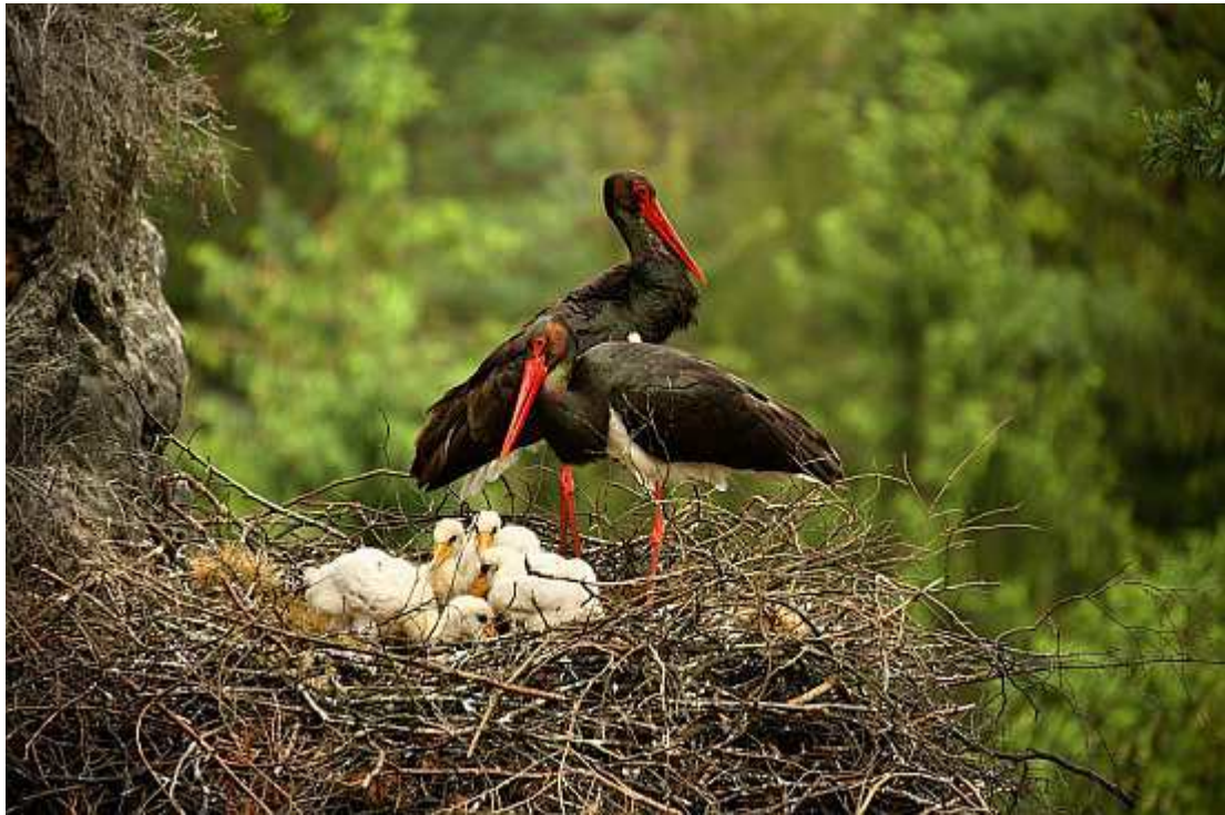
Kompletní rodinka čápů černých