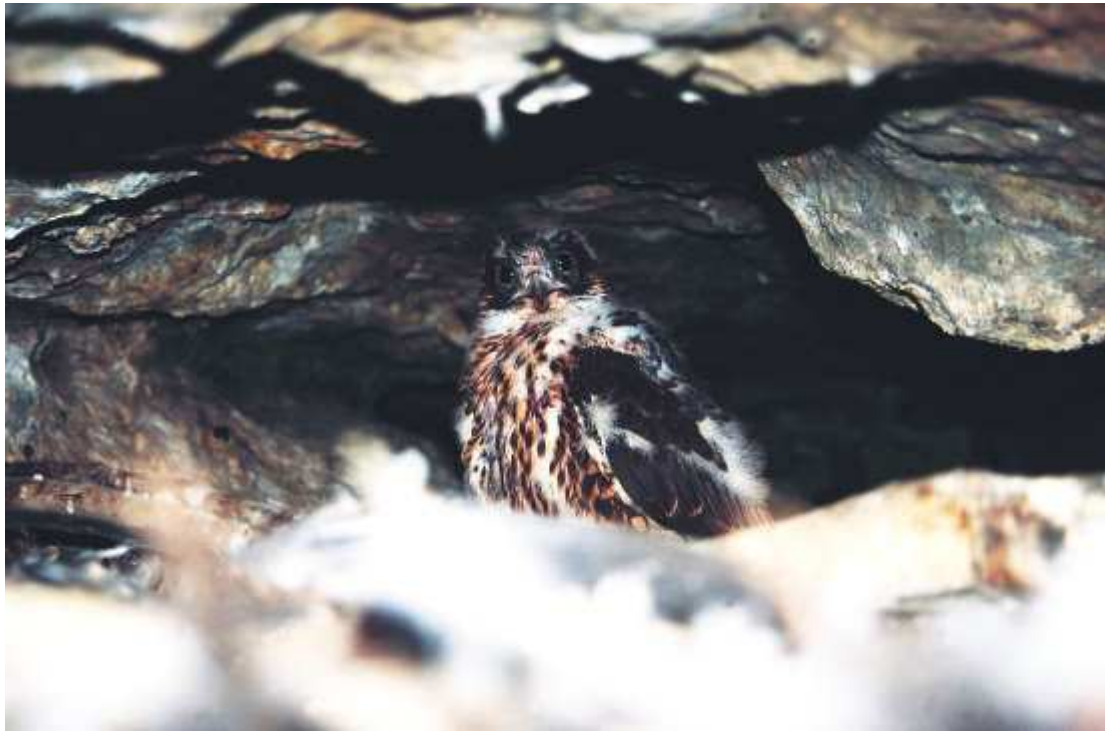
Měsíční mládě sokola stěhovavého