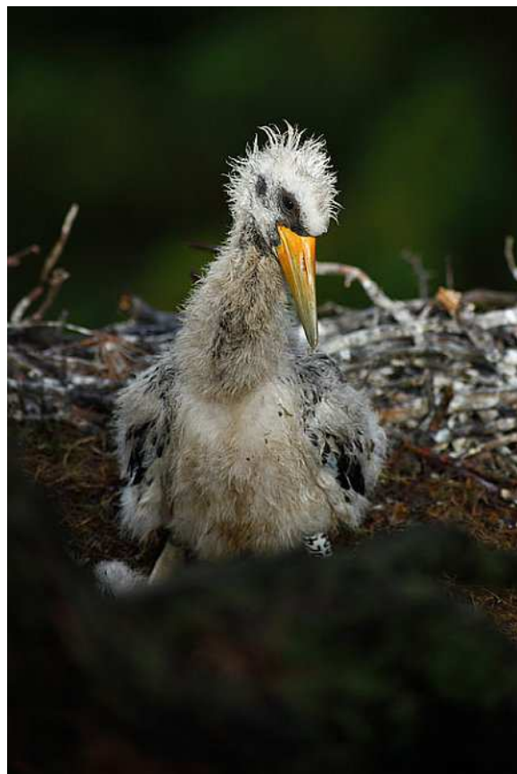
Čáp černý junior