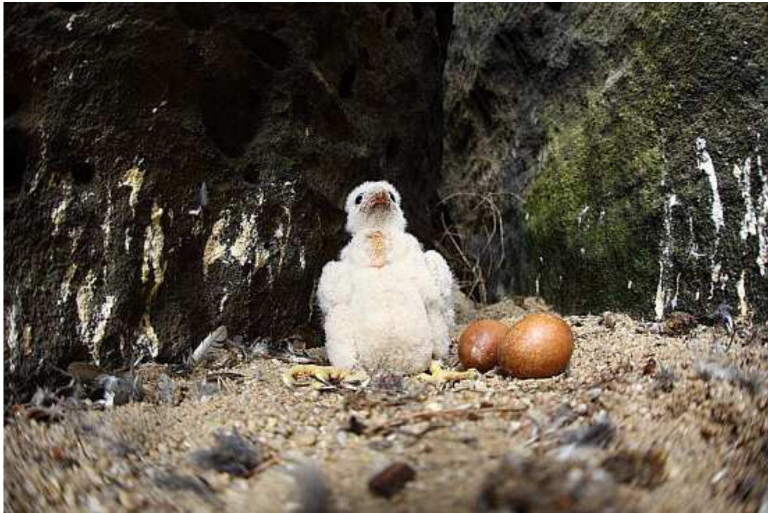
Mládě sokola stěhovavého